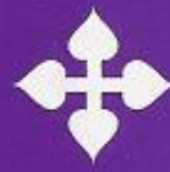
V. H. El Prendimiento de Jesús