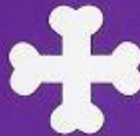
V. H. Santísimo Ecce-Homo (San Miguel)