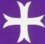
V. H. Santa Cena

Comisión I Centenario Procesión del Silencio integrada por las VV. HH: