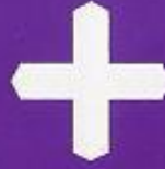
V. H. Jesús orando en el Huerto