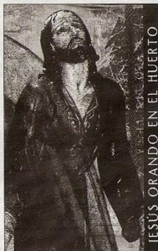
Portada del audiovisual.

mentos y fotografías también se narran episodios como la pérdida del paso de la Guerra Civil, la reconstitución de la hermandad y el encargo a Luis Marco Pérez del nuevo conjunto. Apellidos como Jiménez o Villanueva enlazan con aquellos tiempos.