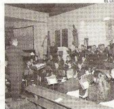
Imagen del Concierto de 2007.