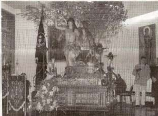
Por primera vez los dos pasos alegóricos de la Oración en el Huerto se dan cita en la iglesia de San Esteban.