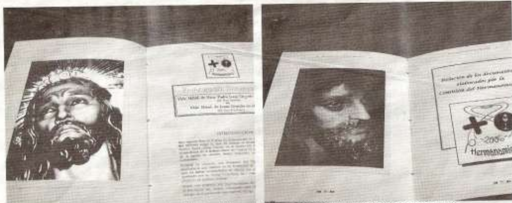
Dos de las hojas del Libro del Hermanamiento que han llevado a cabo las Venerables Hermandades de Ntro. Padre Jesús Orando en el Huerto de San Antón y de San Esteban.

HERMANAMIENTO Vbles. Hdades. de Ntro. Padre Jesús orando en el Huerto de San Antón y San Esteban