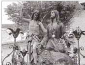
Es portado por el leonero.

Los datos más antiguos que se conocen sobre la Cofradía del Paso del Huerto datan de mediados del siglo XVII, cuando como una Hermandad Real del Cabildo de la Vera Cruz. En el 1741 cuando se independizó de dicho Cabildo. En el siglo XIX se imagina haber que recibiera culto en la ermita de San Roque se trasladó a la Virgen de la Luz por la valla de su primer emplazamiento que había sido quemada por las tropas francesas. Terminada la contienda civil, un grupo de antiguos hermanos se vuelven a reunir con el fin de reimpulsarla, pero lo que al recuperar la antigua imagen de Marco Píres y encargan a este escultor la restauración de la imagen de Cristo. En 1917 este paso es sustituido por el actual, obra de la gubia de Federico Cos-Baut Vales.