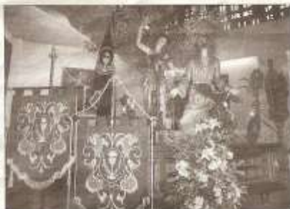
El Huerto de San Antón junto a su guía y estandartes.