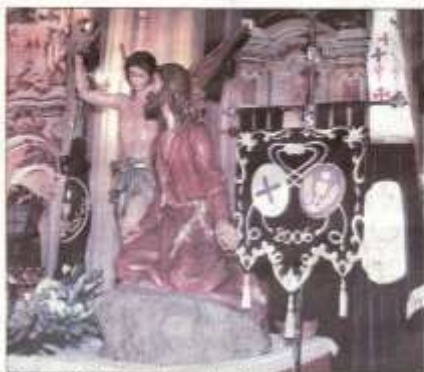
El Huerto de San Antón justo al estandarte del hermanamiento.