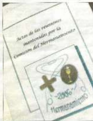
Todo, actos, actas, etc. ha quedado impreso. P. LATORRE