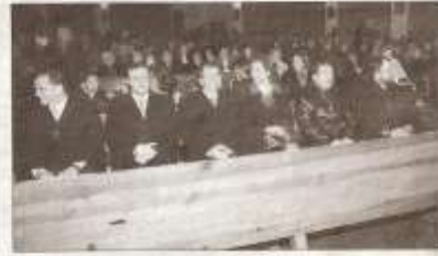
Al acto asistieron diferentes autoridades.