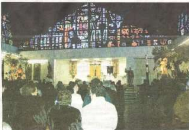
El 26 de febrero las dos Hermandades celebraron el hermanamiento ante una imagen histórica, los dos pasos juntos. T. H. GARCÍA