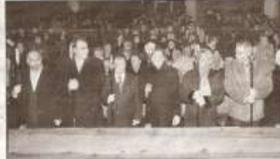
Los hermanos mayores de las hermandades.