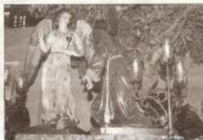
El Huerto de San Esteban con sus veles encendidos. TH BARCEL