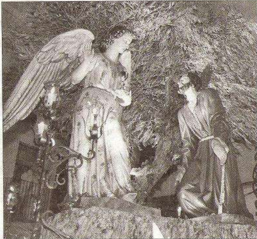
Imagen del Huerto de San Esteban.