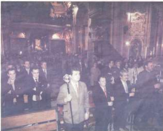
A la función religiosa asistieron miembros de las dos hermandades. T. H. GARCÍA

A lo largo de todo el año mantendrán un contacto fluido, tendrán en cuenta al fin primordial y razón de ser de las Cofradías de la Semana Santa poniendo especial interés en la realización de actividades de carácter asistencial en aquellos sectores de la sociedad más necesitados.