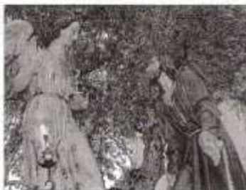
Es portado por el leonero.

Desfile 1968 desfiló este Misterio de la Pasión del Señor en la noche de Miércoles Santo, si bien la fundación de la Hermandad se produjo el 2 de abril de 1925. Es la primera que introduce el alfilerado artificial del paso, cosa que ocurre en 1927.