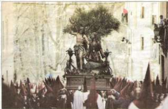
La Hermandad quiere participar en un proyecto internacional relacionado con Cuenca.