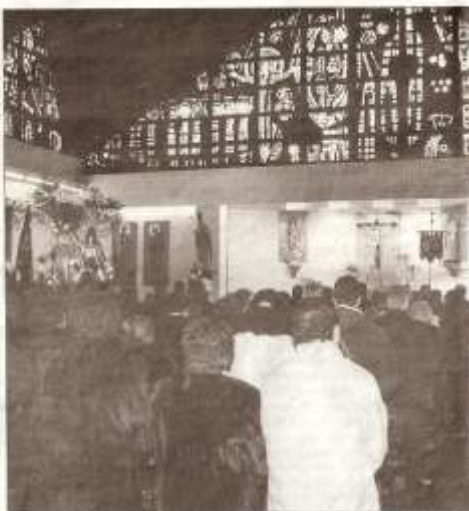
Una imagen histórica. 'Los Huertos' juntos.