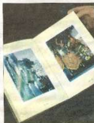
Imágenes del Huerto de San Esteban en el libro. P. LATORRE