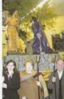
El sábado pasado se inauguró en la entrada a la iglesia de San Esteban un monumento homenaje de la Hermandad de la Oración del Huerto a la Semana Santa de Cuenca.